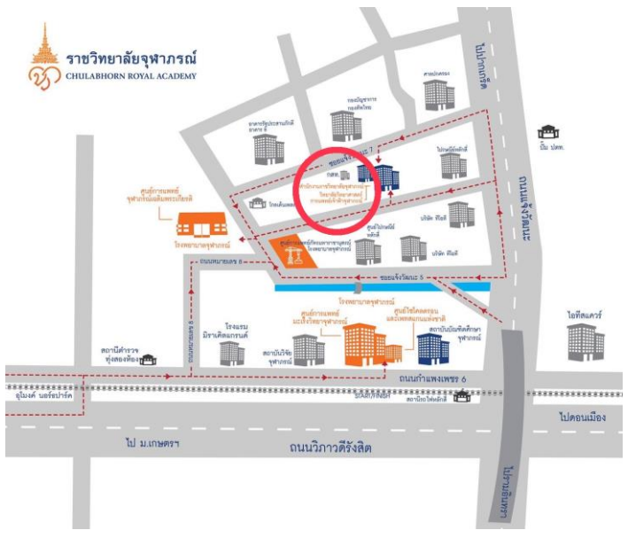
ตำแหน่งที่ตั้ง วิทยาลัยพยาบาลศาสตร์อัครราชกุมารี